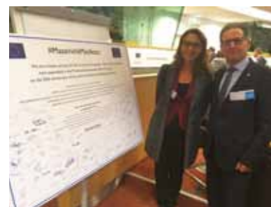
Predstavitelji EZTS GO v Bruslju, oktober 2018

Če se izrazimo s strogo tehničnim izrazoslovjem, je EZTS GO prvi primer izvajanja celostnih teritorialnih naložb na evropski ravni na osnovi skupne strategije z edinim upravičencem. Če isto prevedemo v razumljiv jezik, pomeni, da lahko EZTS GO izvaja skupne projekte v Italiji in Sloveniji in torej lahko izvaja naložbe na skupnem ozemlju treh mest, ne da bi bil omejen z državnimi ali administrativnimi mejami, ki sicer veljajo za območje v pristojnosti treh občin ustanoviteljic.