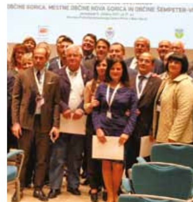
Prvo zgodovinsko srečanje občinskih svetnikov treh občin EZTS GO, oktober 2017

EZTS GO lahko pri izgradnji infrastrukture v okviru evropskih projektov uporablja tako slovensko, kot italijansko zakonodajo s področja javnih razpisov. Občinski sveti treh občin, torej Občine Gorica, Mestne občine Nova Gorica in Občine Šempeter-Vrtojba, so odobrili akt, s katerim so Skupščino EZTS GO pooblastili za vsakokratno odločanje glede uporabe nacionalne zakonodaje. To je tudi prvi sklep, ki so ga sprejeli vsi trije občinski sveti in je temelj za skupno metodologijo prostorskega načrtovanja treh občin.