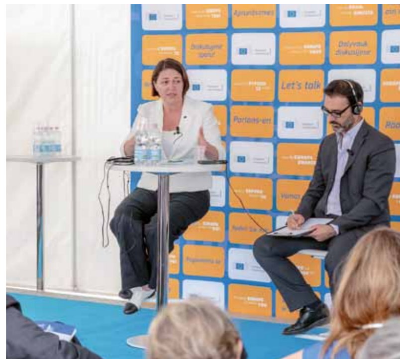
Bivša evropska komisarka za promet Violeta Bulc na Trgu Evrope, julij 2017

Z ustanovitvijo takšne posebne evropske ekonomske cone bi območje EZTS GO pridobilo številne prednosti: znižanje stroškov za investitorje zaradi carinskih olajšav in posledično večjo konkurenčnost podjetij ter povečanje naložb na tem območju.