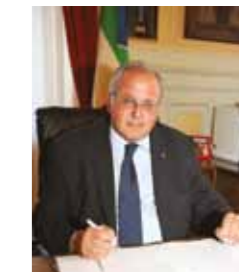
Rodolfo Ziberna Župan Občine Gorica