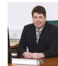
mag. Milan Turk Župan Občine Šempeter-Vrtojba