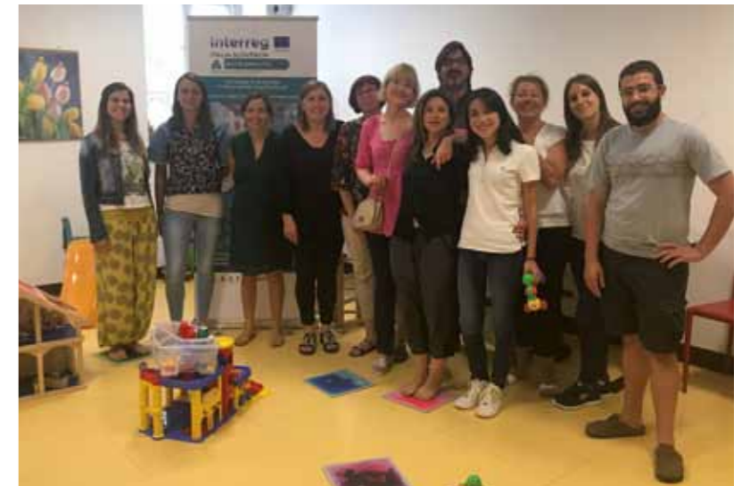
Udeleženci tečaja ESDM, julij 2019

V Parku Basaglia v Gorici so bili urejeni prostori, ki jih bo čezmejna zdravstvena skupina lahko uporabljala za obravnavo otrok z motnjo avtističnega spektra po metodi ESDM. Prostore bodo lahko uporabljali slovenski in italijanski strokovnjaki za obravnavo slovenskih in italijanskih otrok, ki bivajo na čezmejnem območju EZTS GO neglede na državo izvora.