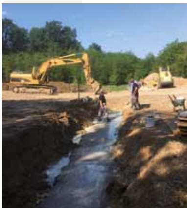
Dela v Vrtojbi

Začetek del: april 2019 Konec del: september 2019