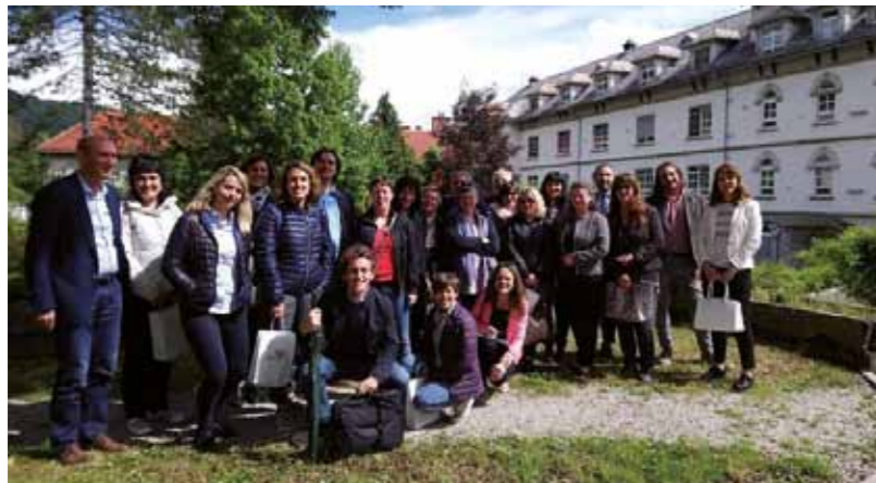
Študijski obisk v Psihiatrični bolnišnici Idrija, maj 2018

V pritličju Skupnostnega centra v Novi Gorici bodo urejeni prostori namenjeni delu skupne čezmejne skupine. Ureditev prostorov bo izvedena s skupnim javnim naročilom EZTS GO in Mestne občine Nova Gorica. Dogovor, s katerim EZTS GO pooblašča Mestno občino Nova Gorica za izvedbo skupnega javnega naročila je v zaključni fazi. Javno naročilo bo objavljeno do konca leta 2019.