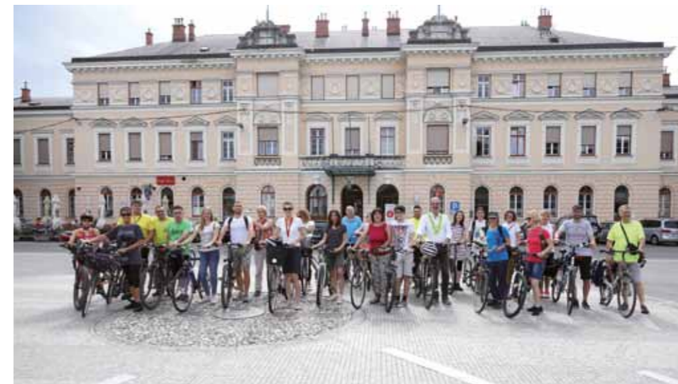
Raziskovanje kolesarskih poti, ki jih bo izvedel EZTS GO, junij 2019

www.facebook.com/eucyclewalk/ twitter.com/eucyclewalk